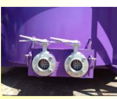
アジテータ排出口 3inc手動バタ弁付×2pcs