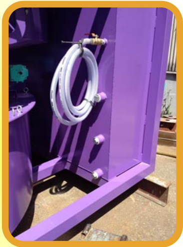
分水器 2 inc×3箇所 洗浄ホース