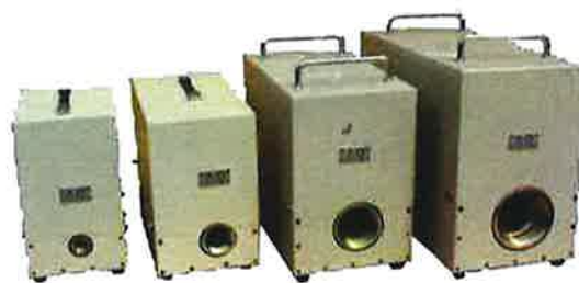
1B(25A) 2B(50A) 3B(80A) 4B(100A)