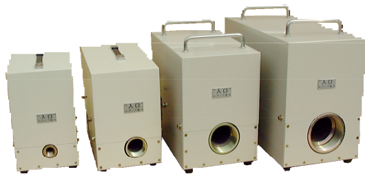
1B(25A) 2B(50A) 3B(80A) 4B(100A)