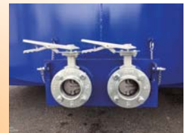
アジテータ排出口 80A手動バタフライバルブ×2pcs