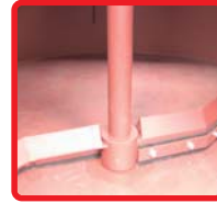
アジテータ攪拌羽